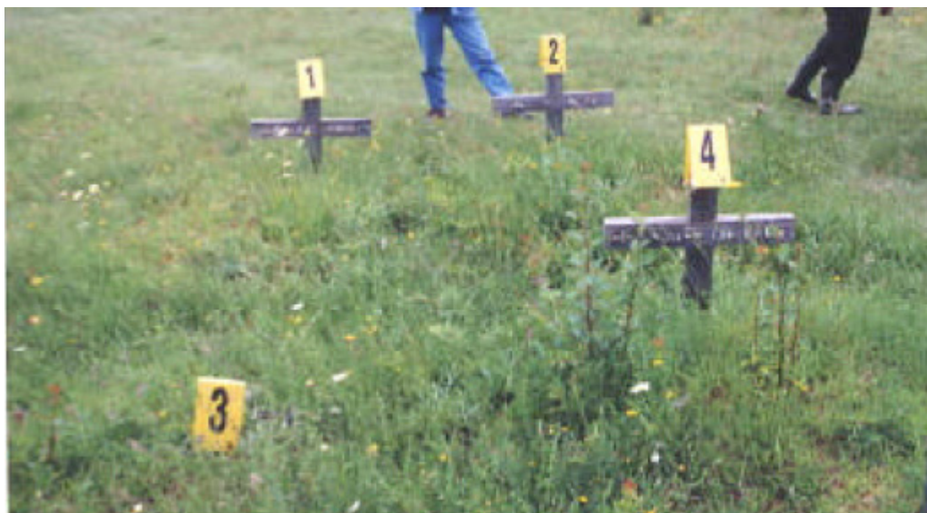
Грбови Новаковића на градском гробљу у Брези.

Жртве: 1) Ранко (Милан) Новаковић, 1934. и његова супруга 2) Обренија (Јово) Новаковић, 1932, његова снаха 3) Милка (Илија) Новаковић, 1934. и његова старија сестра 4) Рајка (Милан) Новаковић- Ристић, 1922.