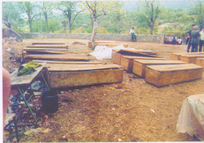
Требиње, 17. август 1993. године: 32 леша српских цивила допремљена са Кућреса. Жртве усташког шерора

Доњи Малован , Општина Купрес, чисто српско село (Срба 398), нашло се на удару и страдало у масовној и неочекиваној оружаномј инвазији регуларних војних јединица Републике Хрватске и хрватско-муслиманских паравојних и параполицијских илегалних формација основаних у БиХ (припадника "Зелених беретки", "Патриотске лиге", ЗНГ и ХОС) на Купрешку висораван, Босну и Херцеговину и СФРЈ 3. априла 1992. Том приликом на веома суров начин убијено је више цивилних лица, поготово мушкараца из српске породице Дувњак. Све жртве овог напада су српске националности. Њихова покретна имовина опљачкана, а непокретна разорена и уништена. Оскрнављена, опљачкана и разорена је и српска православна црква Светог Лазара Косовског.