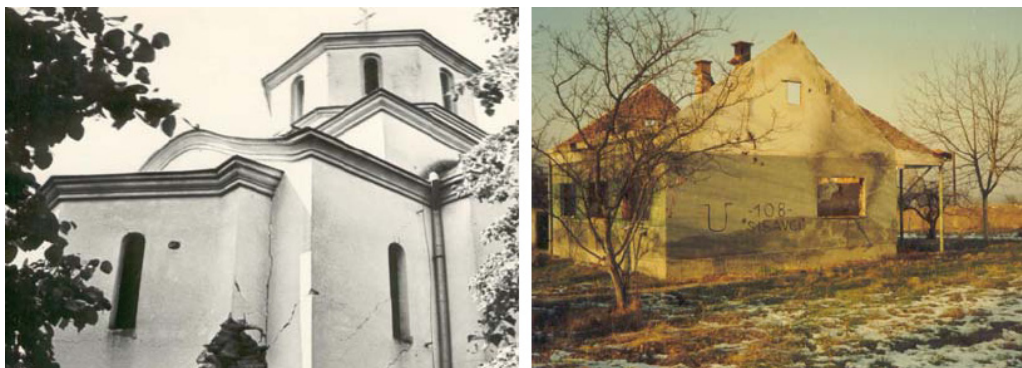
Припадници 108. бригаде хрватске војске после окупације српског села Винска опљачкали су и разорили цркву Рођење Пресвете Богородице. На зиду се види усташко обележје „U“ и назив бригаде 108.