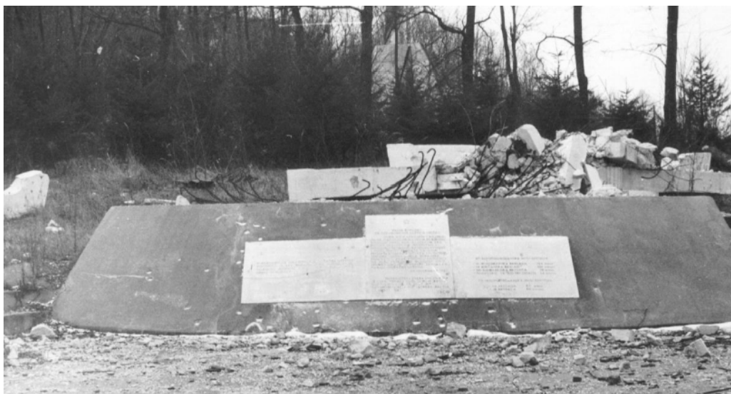
Споменик антифашистима убијеним у Другом светском рату који су 1992. у Г. Свилају минирали и разорили припадници хрватских оружаных снага.