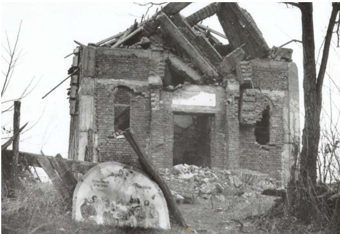
Српска православна црква разорена после хрватске окупације села Г. Свилај 1992.