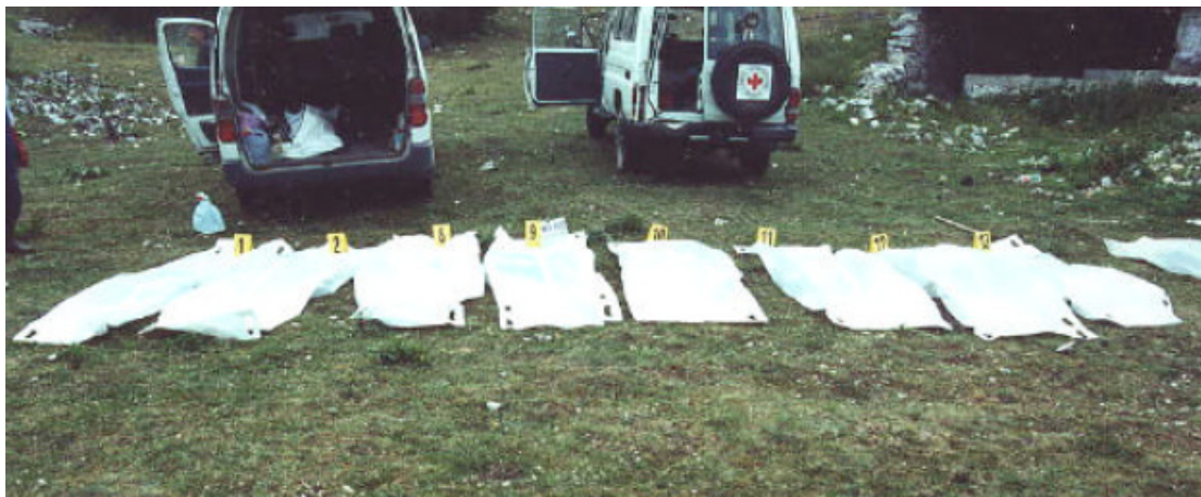
Ексхумација тела српских жртава села Блаце извршена 7. јуна 2000.

Жртве: 1) Јелка (Мирко) Голубовић, 1910; 2) Манојло (Јово) Голубовић, 1912; 3) Радојка (Шћепо) Голубовић, 1915; 4) Спасенија (Симо) Голубовић, 1916; 5) Јелка (Симо) Килибарда, 1912; 6) Милица (Јаков) Килибарда, 1912; 7) Ана (Лазар) Куљанин, 1908; 8) Даница (Спасоје) Куљанин, 1910; 9) Милка Голубовић; 10) Цвија (Марко) Килибарда, 1912.